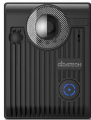
Renova 睿立 APP